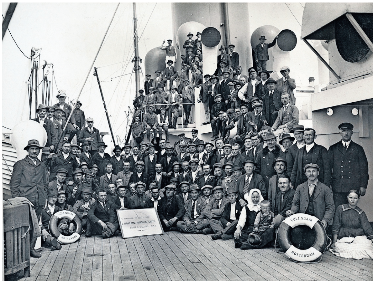
Passagiers aan boord van ss Volendam van de Holland-Amerika Lijn, circa 1925.

Vrijwilligers helpen via website VeleHanden.nl sinds eind vorige maand mee het archief online te brengen, betaald door crowdsourcing. Zij krijgen thuis achter de computer een scan van een passagierslijst te zien en vullen vervolgens de gegevens in op een formulier. Naam, datum van vertrek, dat soort gegevens. Zo kan in de toekomst het in-